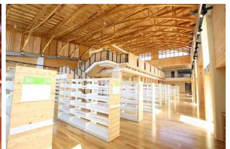
（茂木町まちなか文化交流館ふみの森もてぎ）