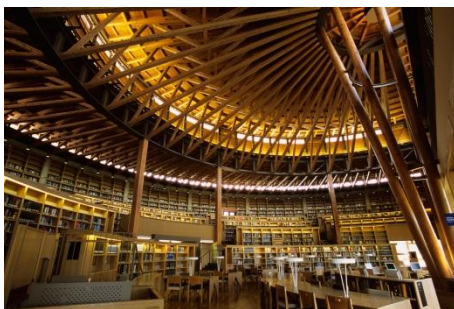
（国際教養大学中嶋記念図書館）