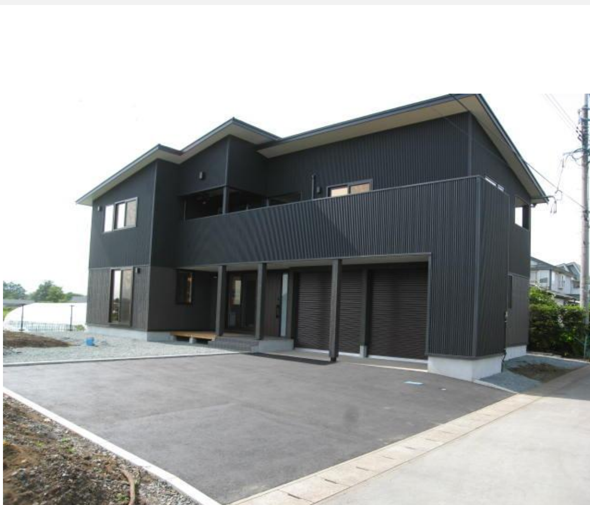
K様邸新築工事完成写真