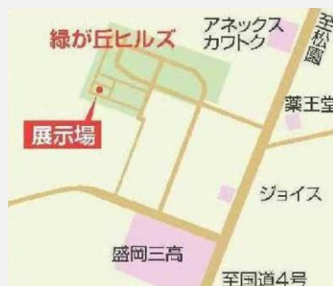
盛岡市緑が丘ヒルズ展示場