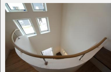
緑が丘ヒルズ展示場・2Fホール吹き抜け『幻の漆喰』

・宮古営業所を開設し（平成23年10月）地域の皆様の住宅に関する相談及び施工、アフターサービスまで常時社員を常駐して対応しております。また、常設展示場も用意して見学に対応しています。定期的な点検サービスは勿論、不具合の際の各機器メーカー・業者との連携にて迅速な対応に努めております。