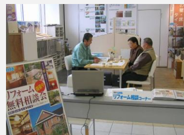
住まいは定期的なメンテナンスが不可欠です。ずっと『おつきあい』させていただきます。