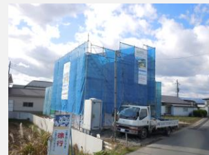
現場はいつもきれいに整然と