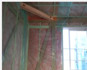
耐震性、省エネ（耐力壁、断熱材）