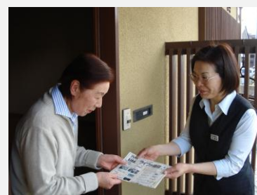
定期的に情報誌を持って訪問します。お困りな事がありましたらご遠慮なくお話しください。