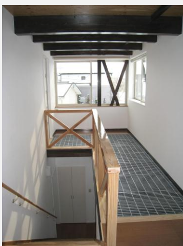
やわらかな光は1階にも注がれます