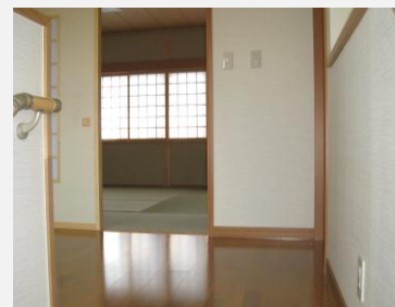
バリアフリー（段差のない床）