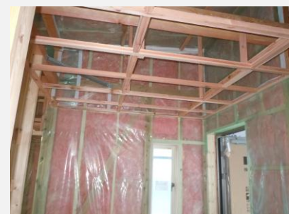
高気密・高断熱施工