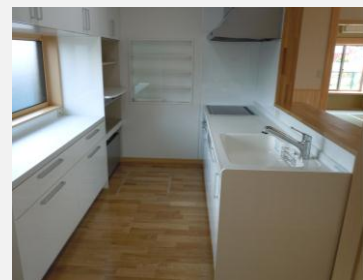
主な設備機器等は一流メーカー品使用