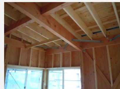
しっかりとした躯体構造