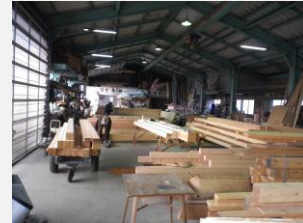
工場にて加工や資材確保します