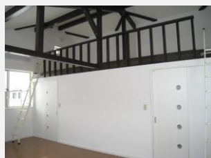
開放的でさわやかな空間です