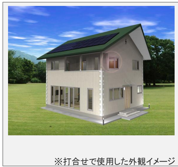
※打合せで使用した外観イメージ