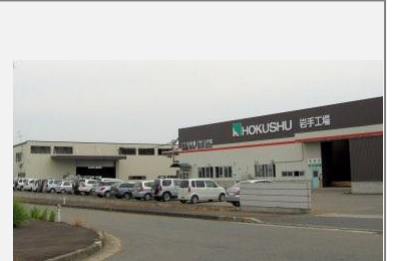
プレカット工場外観