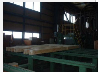
プレカット工場内風景

・ 資材調達は原木業者及び製材業者と建材流通店・プレカット事業者が一環して地域材を安定供給できる体制を整えております。