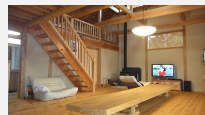
代表事例の写真・図面