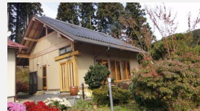
代表事例の写真・図面

・千差万別、人間は皆育ちも生き方も違います。その方々の気持ちをミーティング、設計等でとことん打ち合わせ、希望に出来るだけ近い家を造りたいと思います。