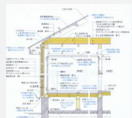
断熱工法の施工例