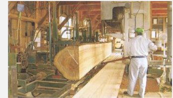
特殊材貯木場・製材所