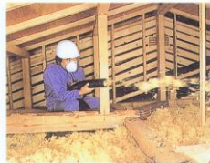
▲吹込み用グラスウールの施工例