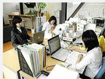
相談受付・一般事務