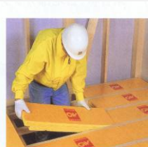
▲床用グラスウールボードの施工