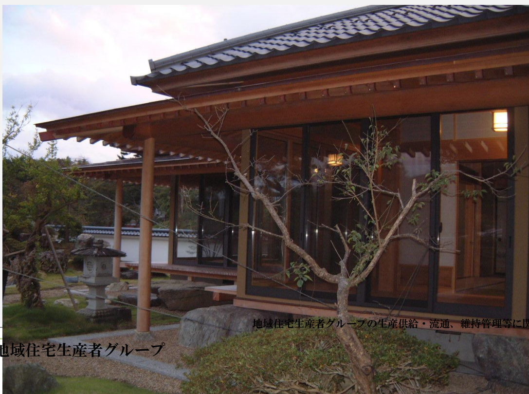
地域住宅生産者グループの生産供給・流通、維持管理等に関する体制

工法については、きれいな空気・湿度・換気等についてはどの仕事も関係がありますので考慮し、設計さんとも打ち合わせしながら進めます。