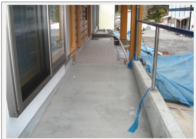
玄関までの バリアフリースロープ