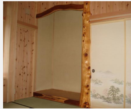
床の間(県産床柱使用)