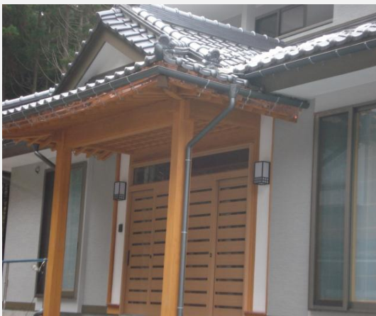
杉材使用の玄関ポーチ