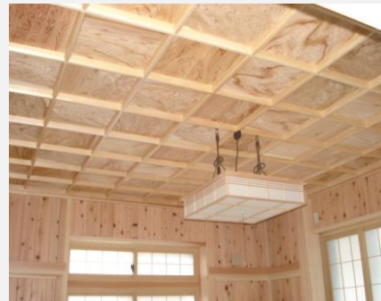
無垢材の格天井(工務店にて製作)

県産材をふんだんに使用し、家中に木の香りが漂い、まるで森林浴をしているかのような居心地良い住まい造りを目指しています。