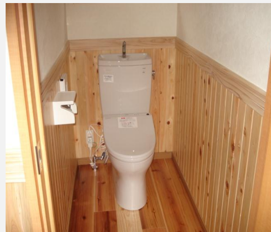
腰壁に杉板を使ったトイレ 杉板は製材所にて加工