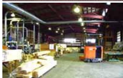
県北住建グループの施工体制