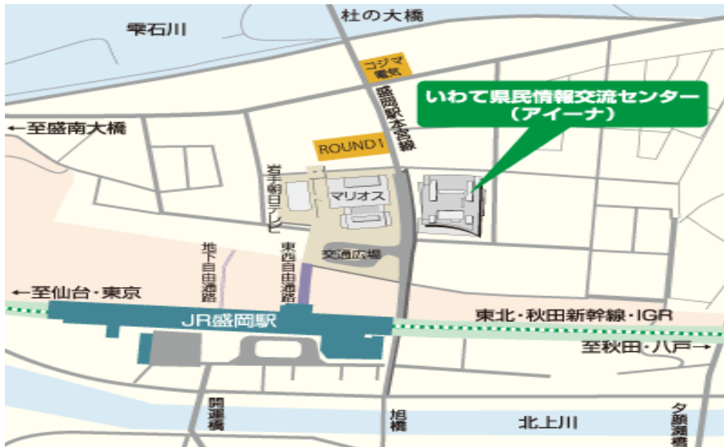
いわて県民情報交流センター アイーナ 盛岡市盛岡駅西通1-7-1