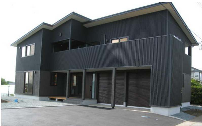
K様邸新築工事完成写真