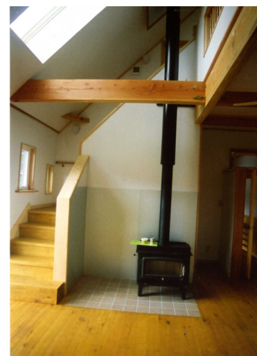
居間と薪ストーブ