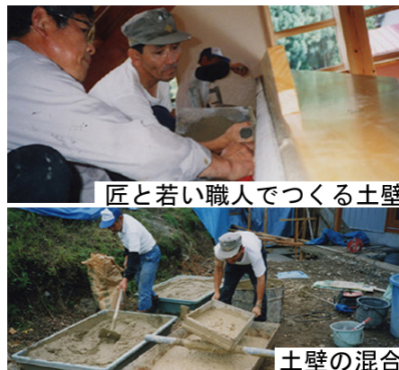
匠と若い職人でつくる土壁