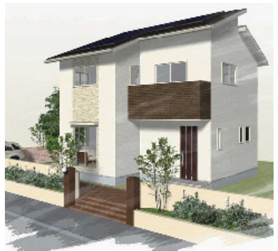
[南玄関タイプ] □1F 床面積 64.59㎡ (19.54坪) □2F 床面積 33.12㎡ (10.02坪) ■総床面積 97.71㎡ (29.56坪)