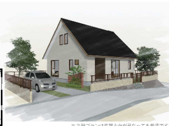
※2階プランは玄関方向が異なっても共通です。